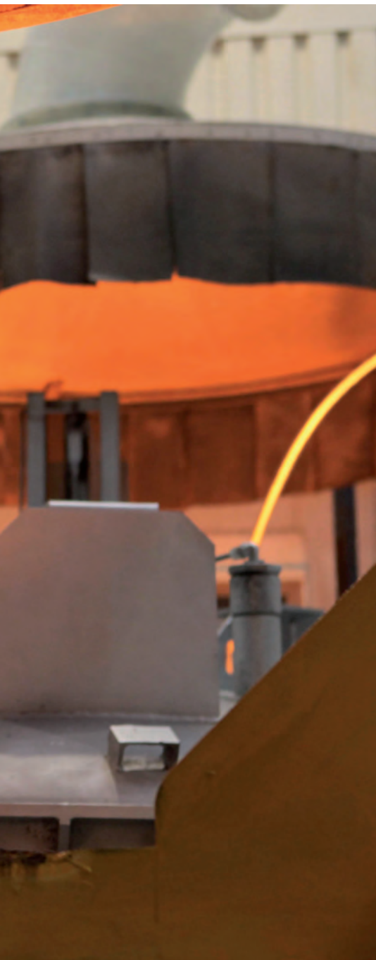
Gießer in einem Bremsscheibenwerk im polnischen Dąbrowa Górnicza - auch hier sind zahlreiche deutsche Gießereimaschinen in Betrieb.