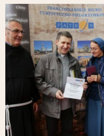
W tegorocznej edycji konkursu nagrodami są pielgrzymki do Lourdes.

Po raz kolejny Targi Kielce i Biuro Turystyczne – Pielgrzymkowe PATRON TRAVEL organizuje konkurs, w którym główną nagrodę stanowią cztery pielgrzymki do Lourdes. Tegoroczna edycja stawia przed uczestnikami zupełnie inne zadanie. Aby wziąć udział w konkursie, należy odwiedzić targi SACROEXPO i prawidłowo wypełnić kupon. Nagrody, podobnie jak w poprzednich edycjach przyznane zostaną w dwóch kategoriach: siostry zakonne i księża-zakonnicy.