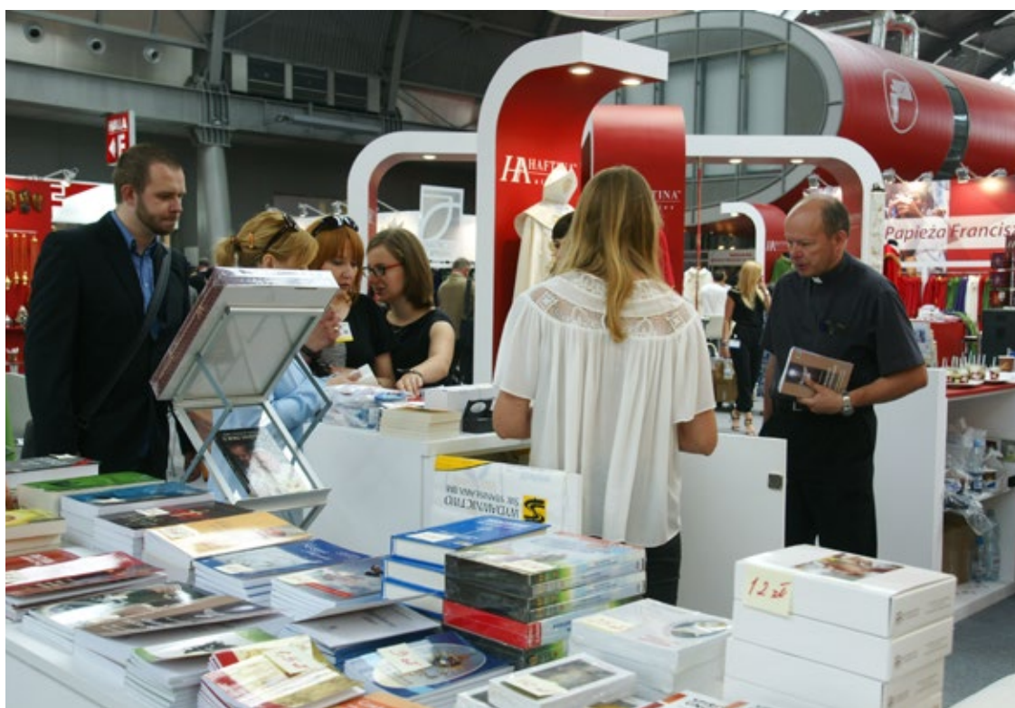
Podczas targów SACROEXPO 2017 swoją ofertę na powierzchni przekraczającej 16 tysięcy metrów kwadratowych zaprezentowało 300 wystawców z 13 krajów

Targi w Kielcach to nie tylko wyposażenie i budownictwo sakralne. Oprócz tradycyjnych stoisk, zwiedzający mają możliwość podziwiania pokazów mody czy wystaw tematycznych. SACROEXPO to także bogata oferta wydawnictw religijnych. Wśród nich pojawia się m.in. Wydawnictwo Jedność, obchodzące w tym roku 100-lecie powstania. Prócz możliwości zakupu nowości wydawniczych w atrakcyjnych cenach to doskonała okazja, aby spotkać się z autorami książek.