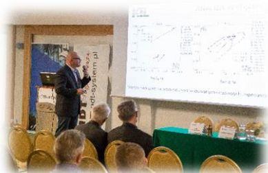
Sesja – sala plenarna

Sesje plenarne i równoległe wypełniło 36 referatów naukowych, których treść została udostępniona na łamach „Przeglądu Spawalnictwa” oraz „Badania Nieniszczące i Diagnostyka”. Poranki i przedpołudnia wypełniło siedem sesji werbalnych. Dodatkowo, mieliśmy okazję poznać opracowania naukowe w formie 5 posterów.