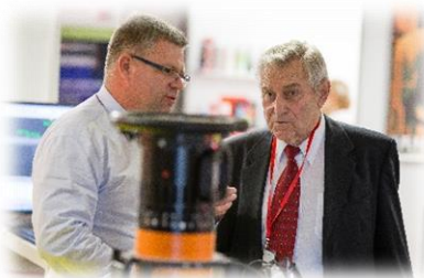
Wystawcy i zwiedzający